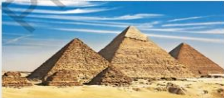
↑ Pirámides de Giza, Egipto, 2500 a.C.