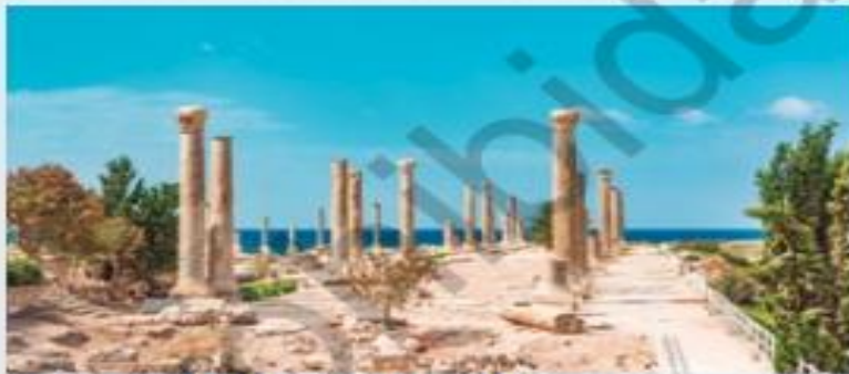
↑ Ruinas de la ciudad fenicia de Tiro.