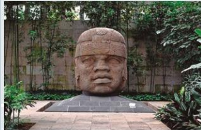
↑ Cabeza colosal olmeca, 1200 al 900 a. C.