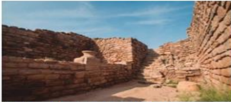
↑ Ruinas de la ciudad india de Harappa.