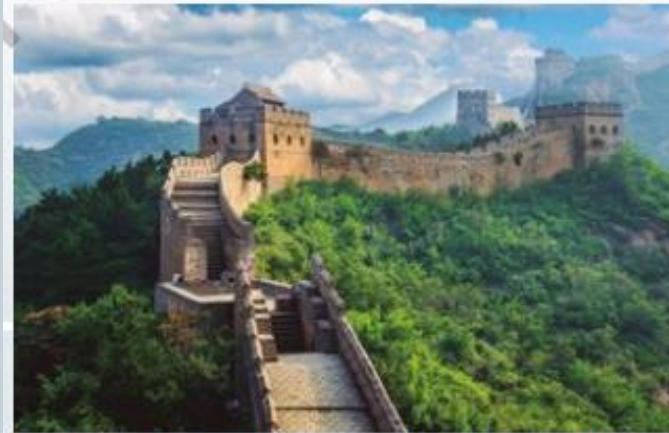
↑ La Gran Muralla China, construcción iniciada en el siglo V a.C.

Se desarrolló entre el 1500 y el 100 a.C., siendo hacia el 1200 a.C. que construyeron importantes centros urbanos con un marcado rol ceremonial.