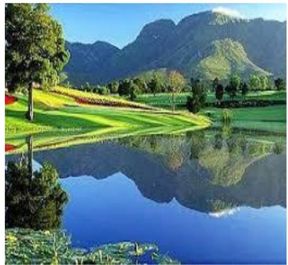
Un medio Ambiente sin Personas