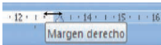
Fig. 6.8. Fijando el margen derecho.