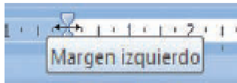
Fig. 6.9. Fijando el margen izquierdo.

3. Realiza la misma operación con el margen izquierdo ( Figura 6.9 ), superior e inferior. Ten en cuenta que los dos últimos se modifican sobre la Regla vertical.