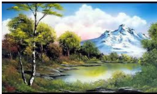
Imagen Paisaje Natural

Observa las diversas manifestaciones artísticas de nuestro entorno Social Cultural, su diversidad cultural, el medio ambiente, la naturaleza; y como expresar los sentimientos a través de la creación de cada trabajo en forma personal; desarrollando las diversas habilidades y competencias; y apoyándose de diversos recursos , materiales y técnicas alternativas.